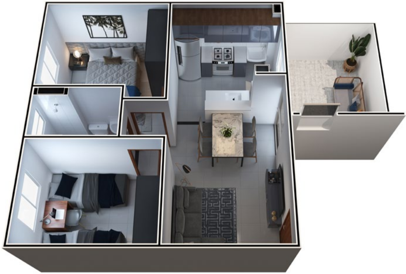
APTO 101 BLOCO 9