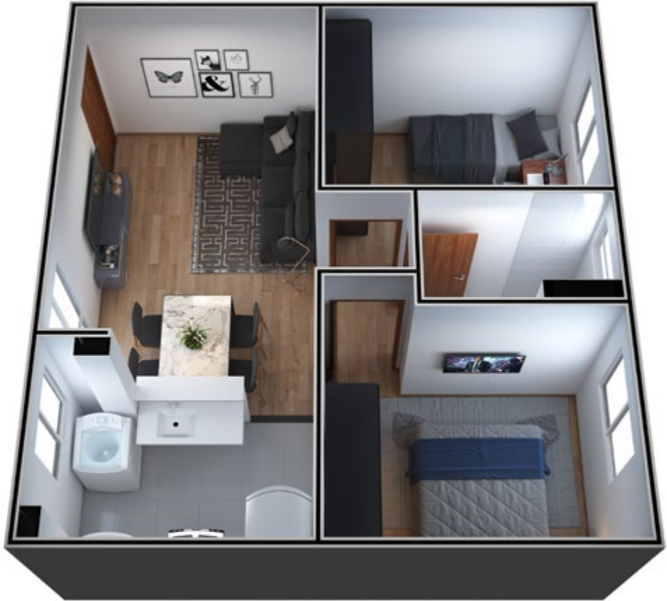
APTO 304 BLOCO 9